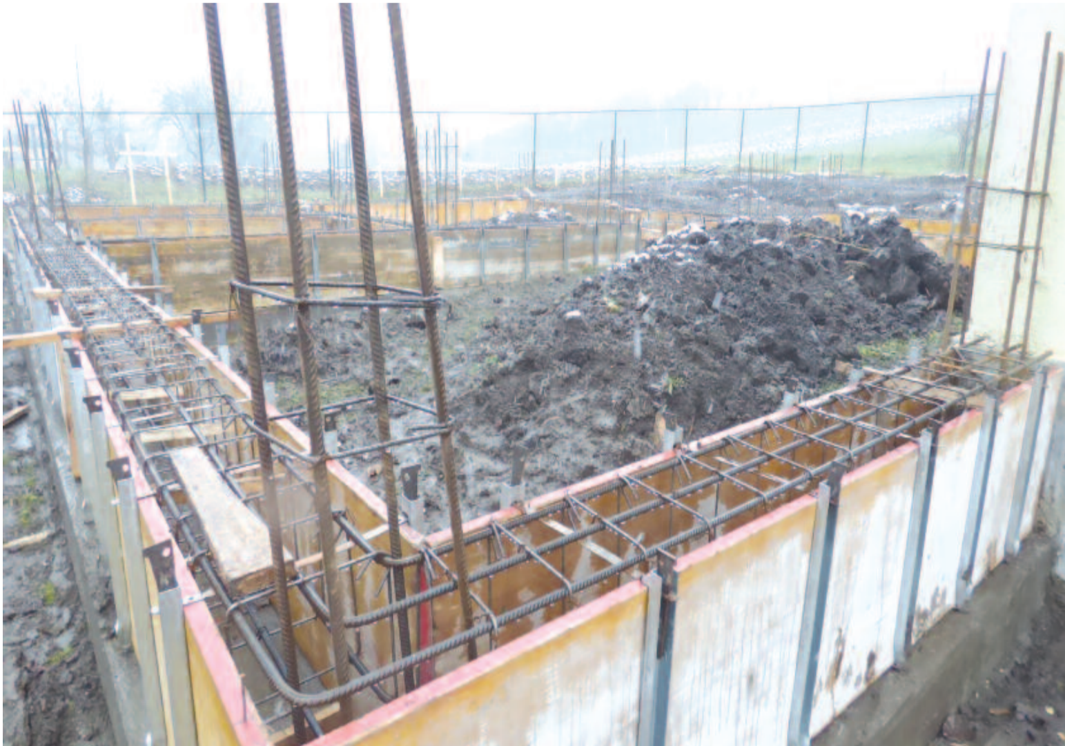
Zajlanak az alapozási munkálatok, de jövő szeptemberben már teljesen új épület fogadná a gyerekeket