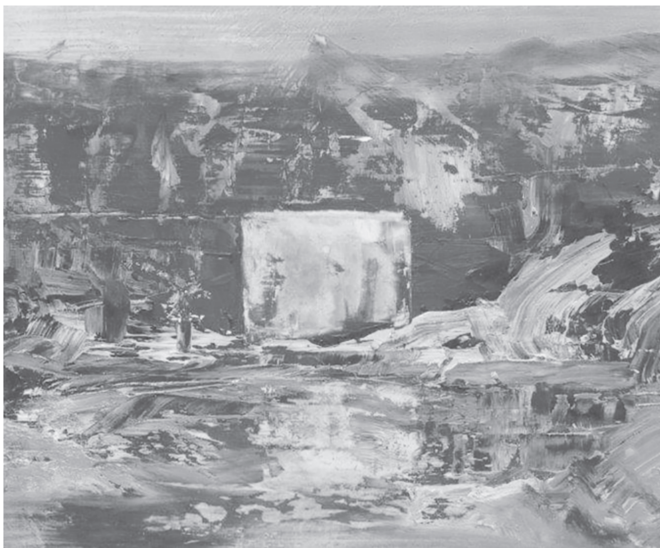
Csóka Szilárd-Zsolt festménye

Itt van egy pompás, aranyozott keret. Teljesen üres, de bent még hull a hó.